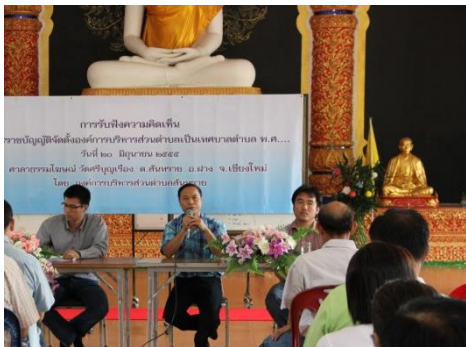
การรับฟังความคิดเห็นการจัดตั้ง อบต.เป็นเทศบาล