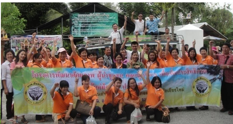
โครงการพัฒนาศักยภาพผู้นำชุมชน