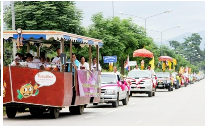
โครงการแห่เทียนพรรษา