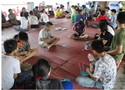
โครงการอาสาสมัครดูแลสุขภาพผู้สูงอายุที่บ้าน(อพส)