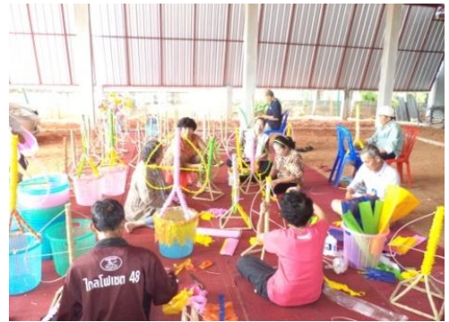
โครงการส่งเสริมอาชีพผู้สูงอายุ