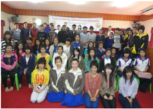
โครงการจ้างนักเรียน นักศึกษาช่วงปิดภาคเรียน