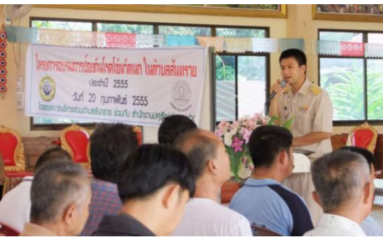
โครงการป้องกันโรคไข้หวัดนก