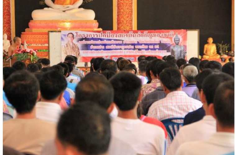
โครงการปกป้องสถาบัน