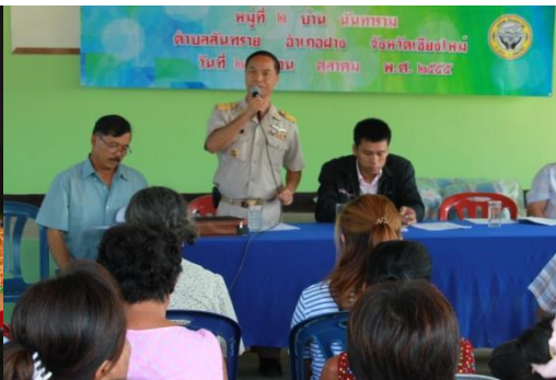
ประชาคมการจัดตั้งและเปลี่ยนแปลงฐานะ อบต.จัดตั้งเป็นเทศบาล