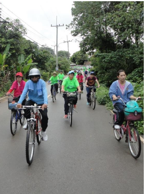
โครงการปั่นจักรยาน สานรัก สร้างครอบครัว