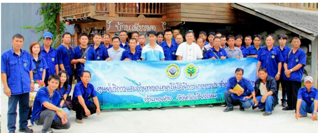
ศูนย์บริการและถ่ายทอดเทคโนโลยีการเกษตรประจำตำบลสนทรายศึกษาดูงาน