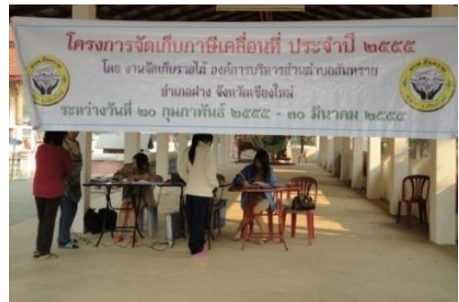
โครงการจัดเก็บภาษีเคลื่อนที่