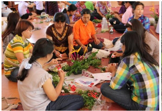
โครงการสานรักสร้างอาชีพ ครอบครัวยุคใหม่