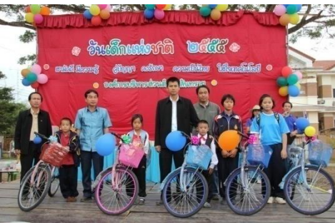
โครงการวันเด็กแห่งชาติ