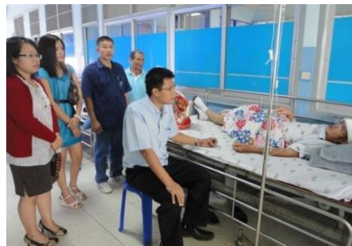
โครงการเยี่ยมผู้สูงอายุ