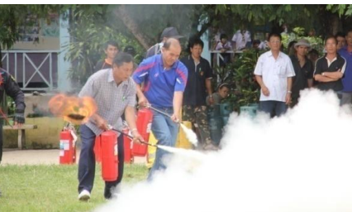
โครงการซ้อมแผนป้องกันและบรรเทาสาธารณภัย