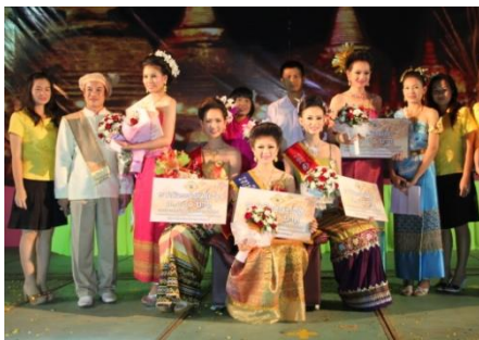
ประเพณีลอยกระทง