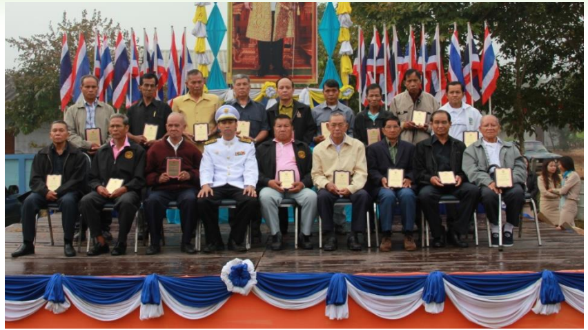
โครงการวันพ่อแห่งชาติ