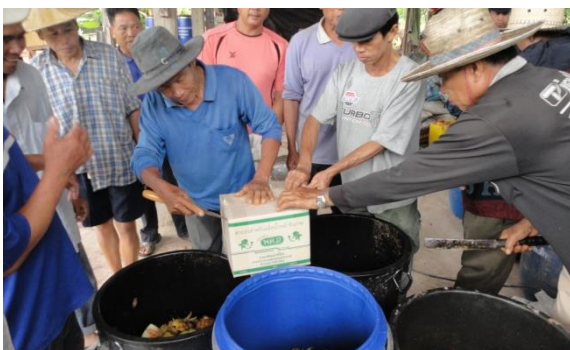
โครงการผลิตน้ำหมักชีวภาพ