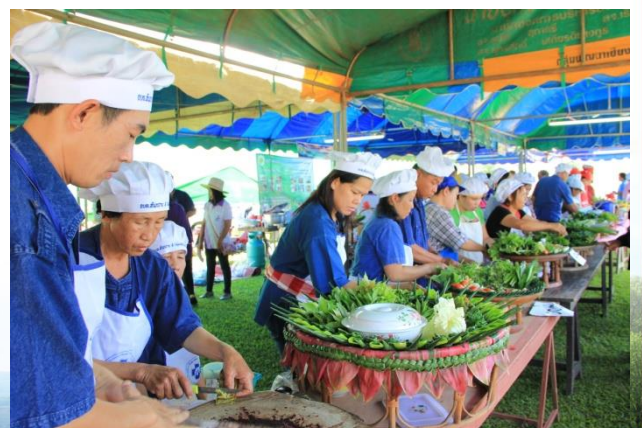
งานวันเกษตรกรตำบลสนทราย

รายงานผลการปฏิบัติงานประจำปี ๒๕๕๕ อบต.สนทราย