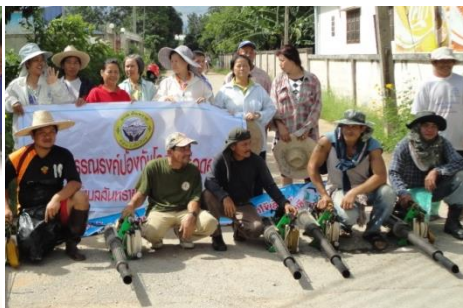
รณรงค์ป้องกันโรคไข้เลือดออก