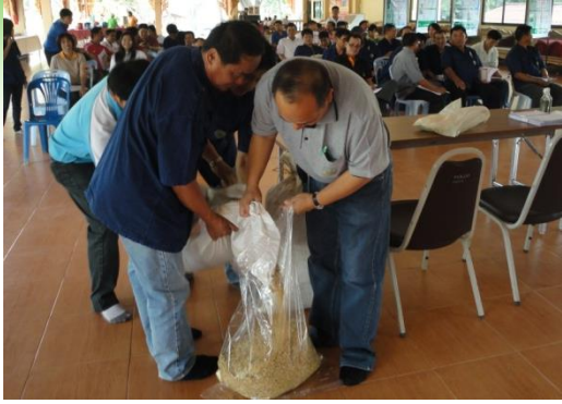
โครงการอบรมและรณรงค์การปลูกเมล็ดพันธุ์ข้าว