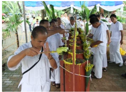
โครงการหล่อเทียนพรรษา