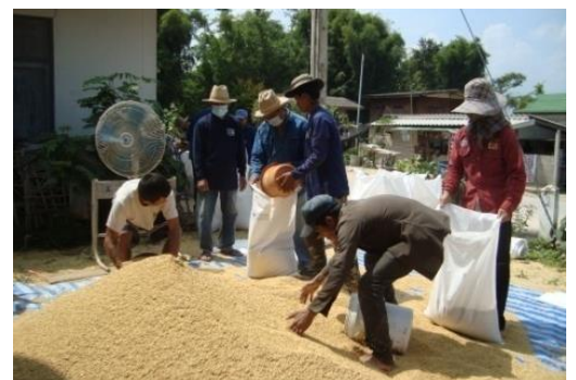
จัดทำแปลงเมล็ดพันธุ์ข้าวสันป่าตอง ๑