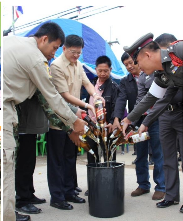
โครงการลดอุบัติเหตุในช่วงเทศกาลปีใหม่