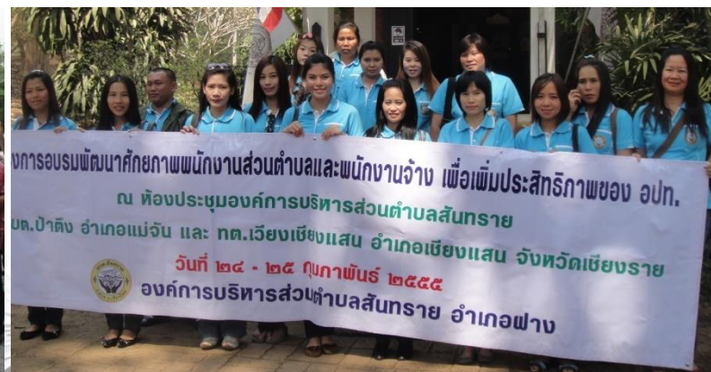
โครงการพัฒนาศักยภาพพนักงานส่วนตำบลและพนักงานจ้าง