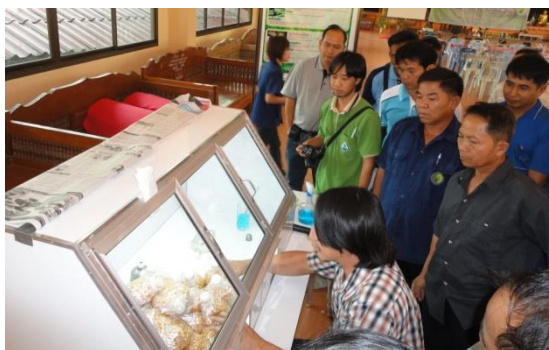
โครงการเพาะเลี้ยงเชื้อราบิวเวอร์เรีย