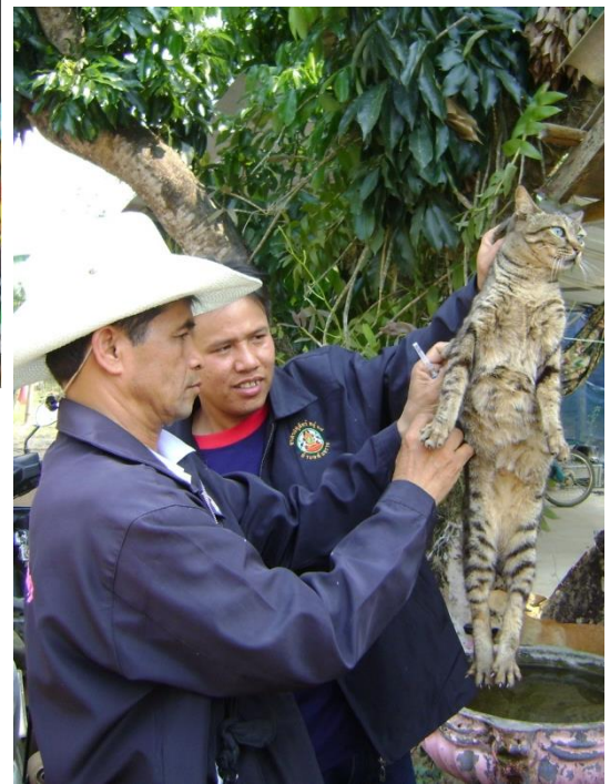
รณรงค์ป้องกันโรคพิษสุนัขบ้าและแมว