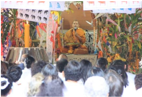
ตั้งธรรมหลวง