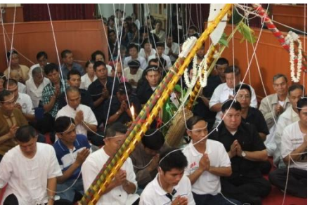
โครงการสืบชะตาอบต.สันทราย