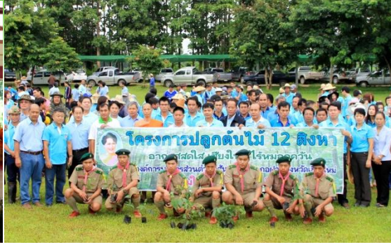
โครงการปลูกต้นไม้ ๘๐๐ ล้านกล้า มหาราชินี