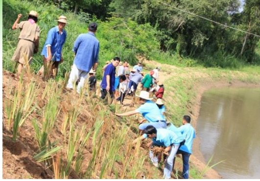
โครงการปลูกหญ้าแฝกเฉลิมพระเกียรติ