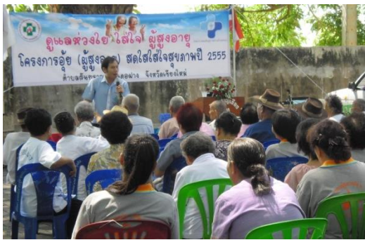
โครงการอู่สายตาใส่ใจสุขภาพ