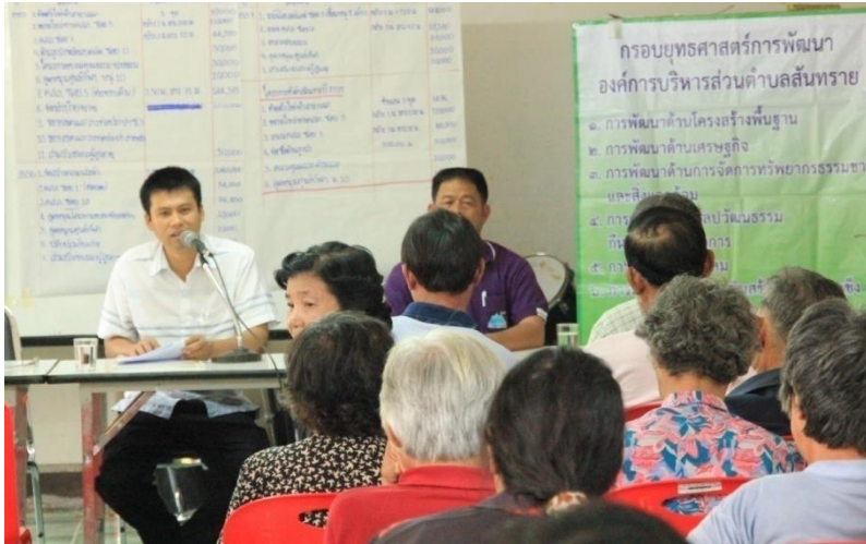
โครงการเวทีประชาคมหมู่บ้านตำบลสันทราย