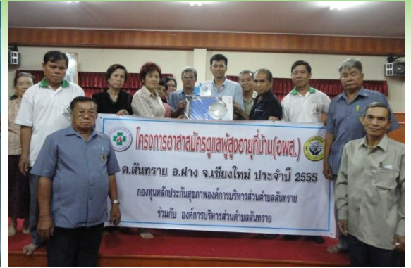
โครงการอาสาสมัครดูแลสุขภาพผู้สูงอายุที่บ้าน(อพส)