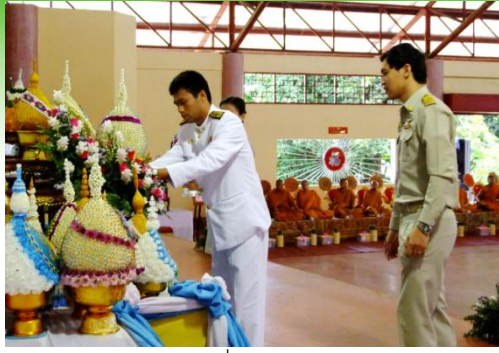
ถวายพระพรเนื่องในวันแม่แห่งชาติ