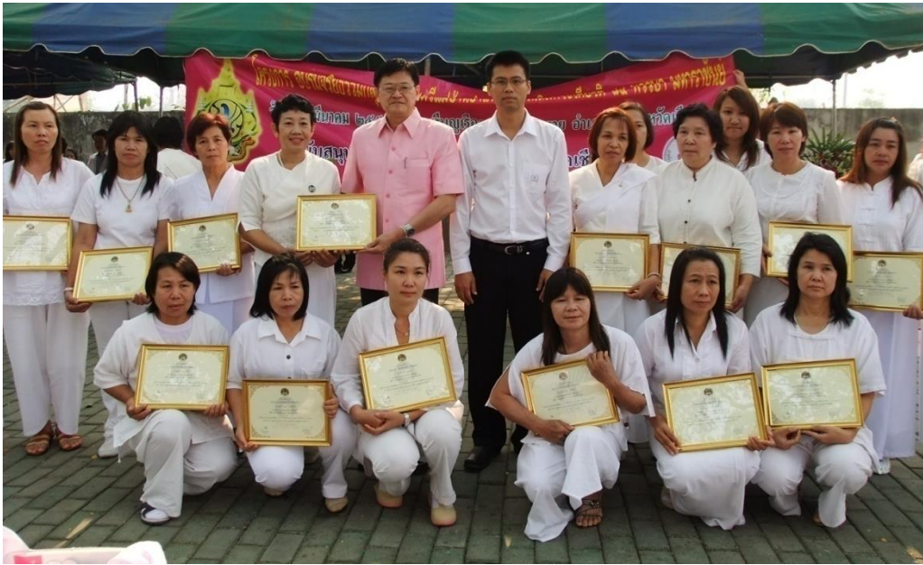
โครงการสตรีสากล