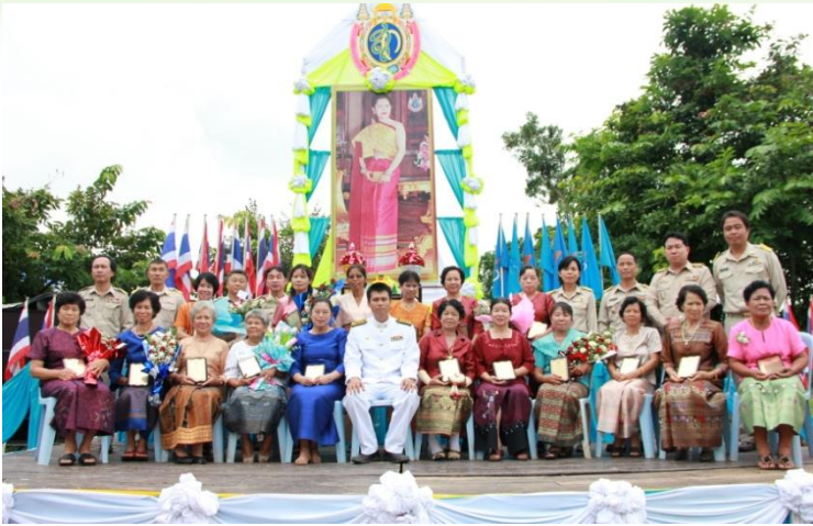
โครงการวันแม่แห่งชาติ