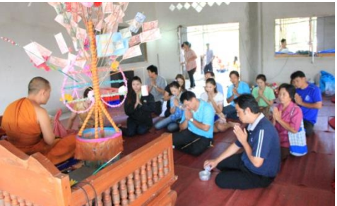
ประเพณีสลากกัณฑ์