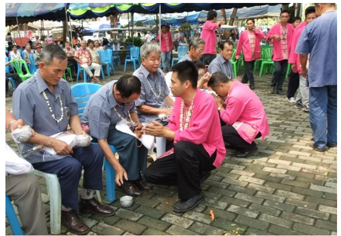
ประเพณีร่อนน้ำตาหัวผู้สูงอายุ