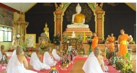
โครงการบวชพระภิกษุสามเณร