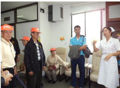
โครงการพัฒนาศักยภาพผู้สูงอายุ