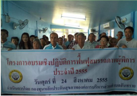
โครงการอบรมเชิงปฏิบัติการฟื้นฟูสมรรถภาพผู้พิการ ประจำปี 2555