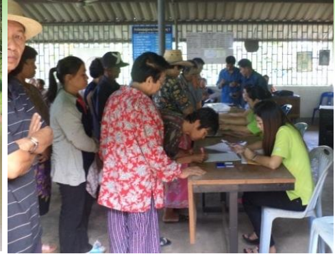
แจกเบี้ยยังชีพผู้สูงอายุและผู้พิการ