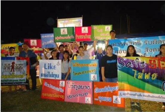
รณรงค์เนื่องในวันเอดส์โลก