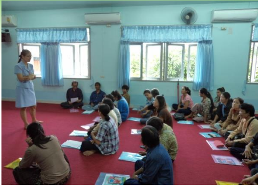
โครงการส่งเสริมคุณภาพกลุ่มเพื่อนช่วยเพื่อน