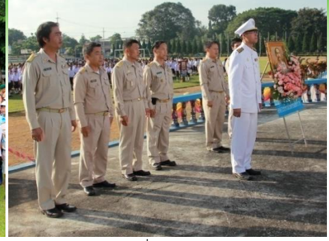
วางพวงมาลาเนื่องในวันปิยะมหาราช