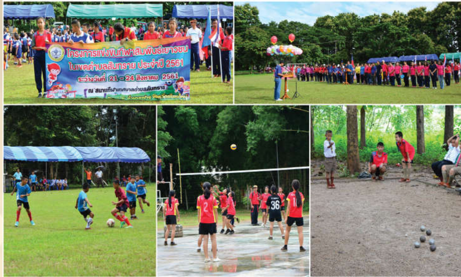
โครงการกีฬาสัมพันธ์เยาวชนในเขตตำบลสันทราย