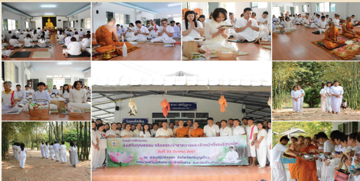
โครงการฝึกอบรมส่งเสริมคุณธรรมจริยธรรมข้าราชการและเจ้าหน้าที่ของรัฐยุคใหม่