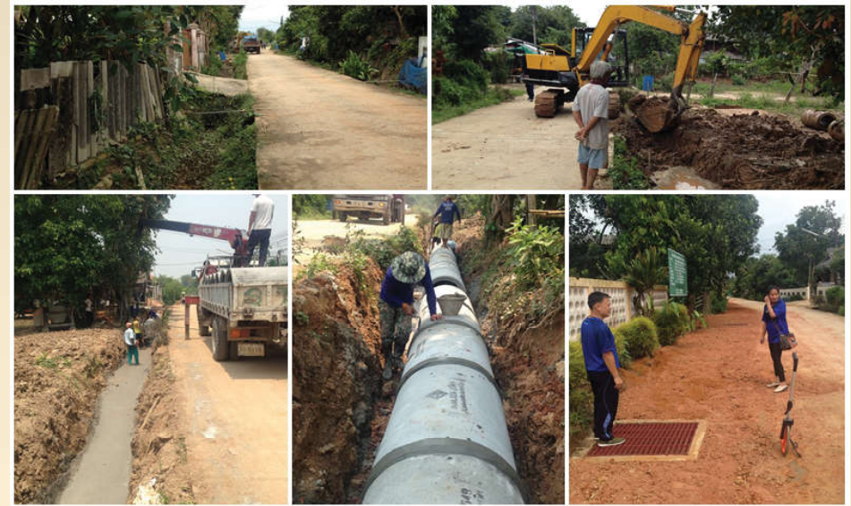
โครงการวางท่อระบายน้ำ คสล.พร้อมบ่อพัก หมู่ที่ 2 บ้านนันทาราม