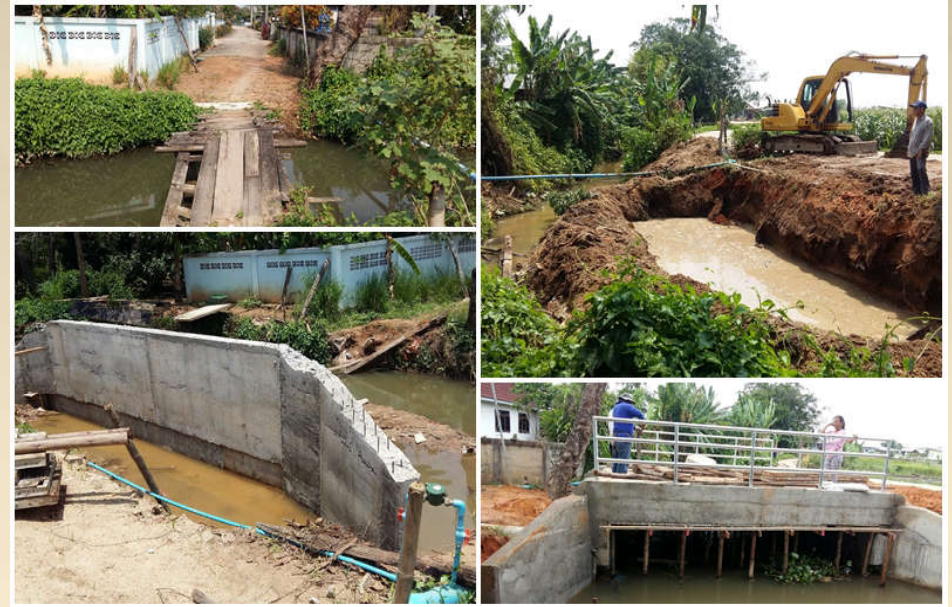
โครงการก่อสร้างสะพาน คสล. หมู่ที่ 15 ซอย 1