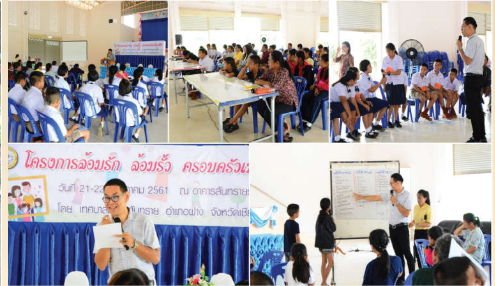
โครงการล้อมรั้วล้อมรั้วครอบครัวเข้มแข็ง