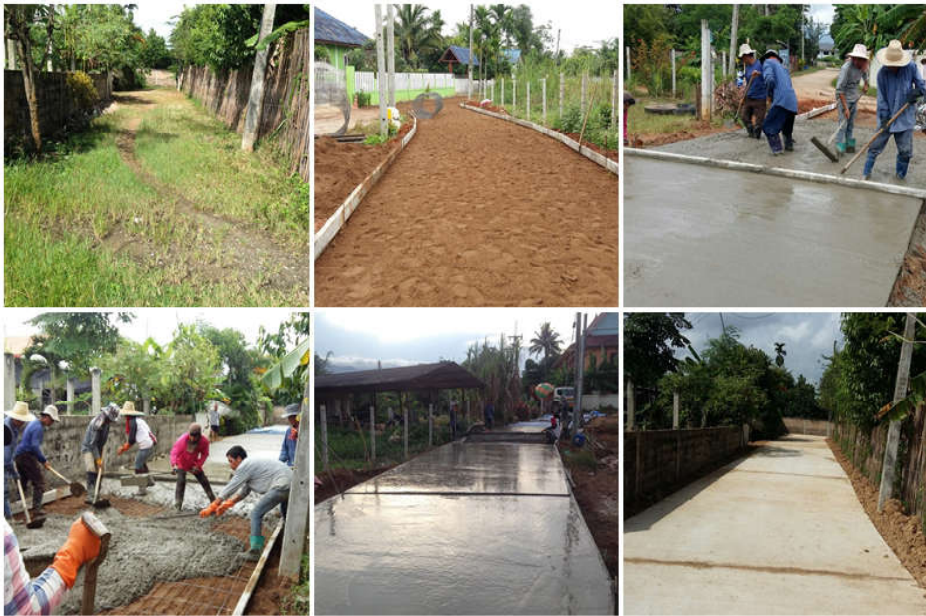
โครงการก่อสร้างถนน คสล.หมู่ที่ 17 บ้านต้นสำโน ซอย 4