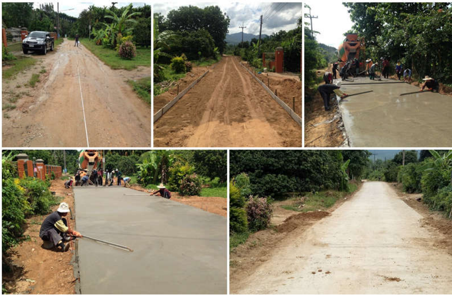
โครงการก่อสร้างถนน คสล. ม.5 เข้าหน่วยจัดการต้นน้ำแม่เผาะ