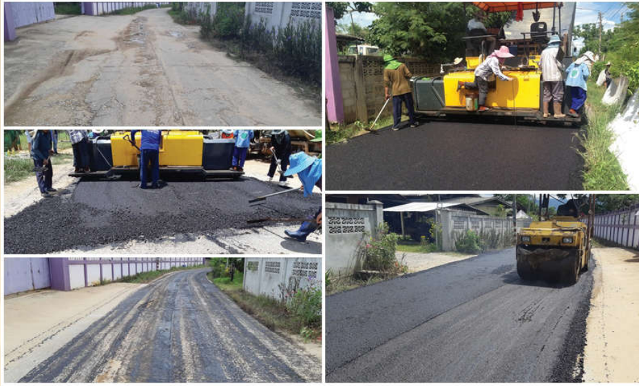
โครงการก่อสร้างถนนพาราแอสฟัลท์ติกคอนกรีต หมู่ที่ 16 ซอย 7