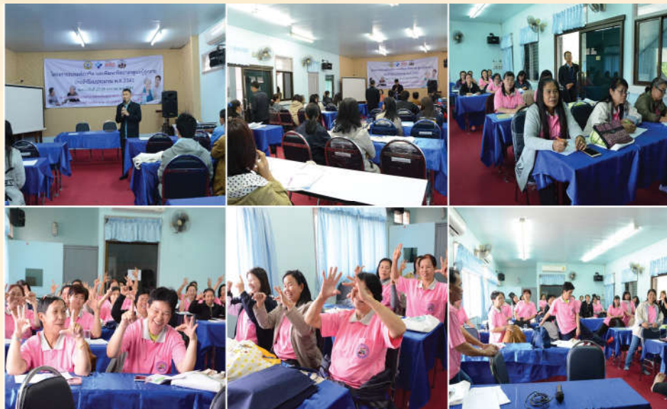
โครงการส่งเสริมและพัฒนาจิตอาสาသူแลผู้สูงอายุ