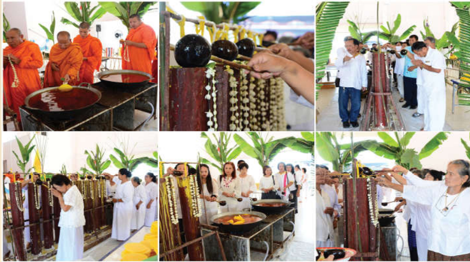
โครงการหล่อเทียนถวายเทียนจำนำพรรษา