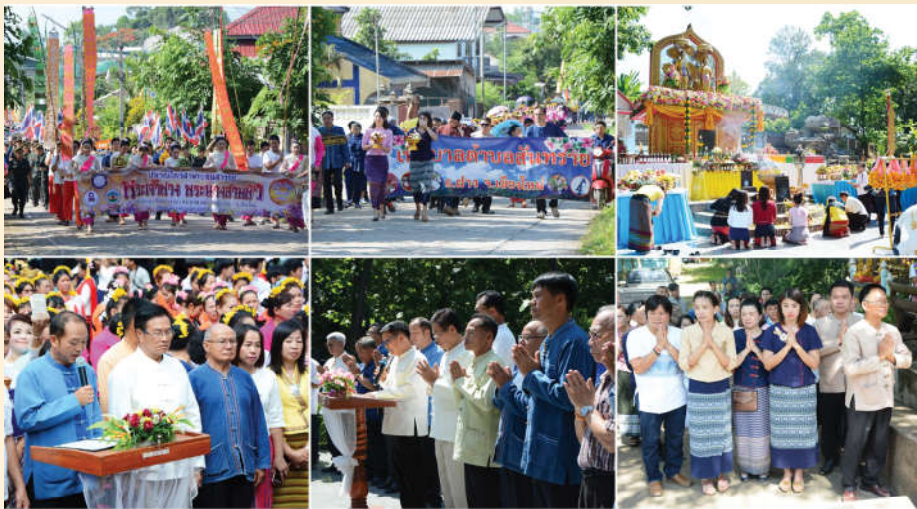
โครงการบวงสรวงสักการะอนุสาวรีย์พระเจ้าฟ้างพระนางสามผิ