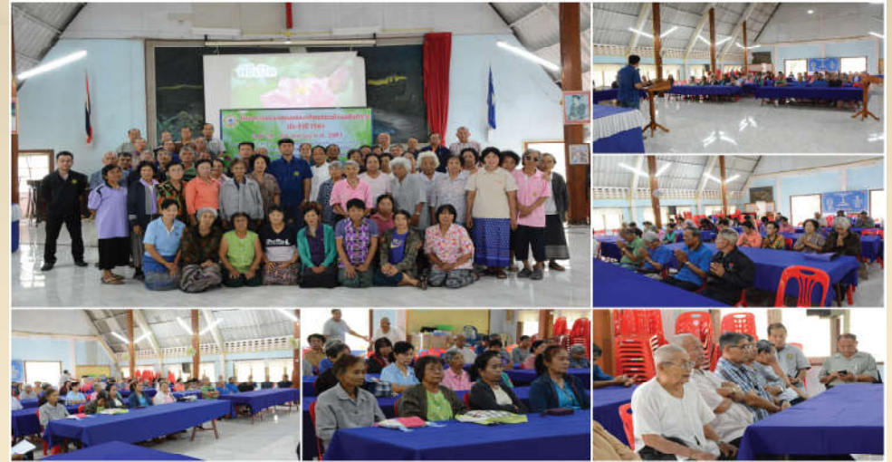
โครงการอบรมคุณธรรมจริยธรรมตำบลสันทราย