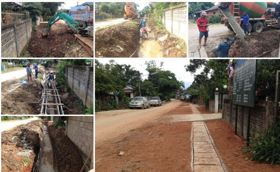
โครงการก่อสร้างวางระบายน้ำ คสล.ถนนสายหลัก หมู่ที่ 1 บ้านแม่มาว