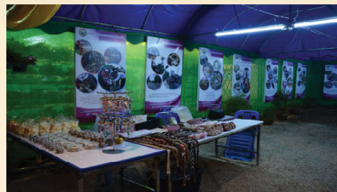
โครงการส่งเสริมการมีส่วนร่วมของประชาชนในการบริหารท้องถิ่น(การประชุมสภาพลเมือง)